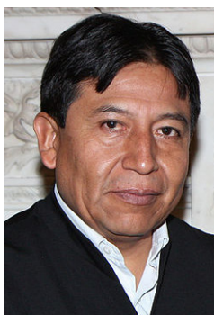
David Choquehuanca Céspedes