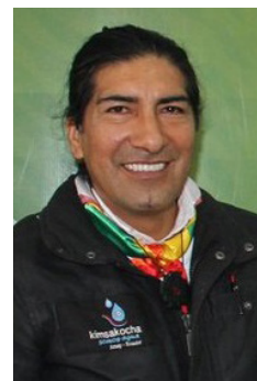
Yaku Pérez Guartambel

Secretaria Ejecutiva de la Confederación Nacional de Mujeres Campesinas Indígenas Originarias de Bolivia "Bartolina Sisa"