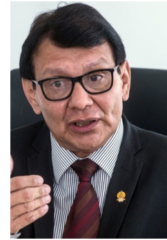
Franklimberg Ribeiro de Freitas

Director General de Relaciones Multilaterales del Ministerio de Relaciones Exteriores del Estado Plurinacional de Bolivia Delegado Gubernamental Alternativo de Bolivia ante el FILAC