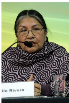
Tarcila Rivera Zea

Miembro Experta del Foro Permanente de las Naciones Unidas para las Cuestiones Indígenas